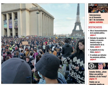
Manifestación en París contra la ley de Seguridad Global

EDITORIAL Presupuestos contra reivindicaciones El gobierno de Sánchez ha presentado un presupuesto que, en su esencia, es un presupuesto de recortes. Aunque se anuncie que se van a crear puestos de trabajo, se trata de un presupuesto que busca reducir el gasto público y aumentar los ingresos. Esto significa que se van a recortar servicios públicos, se van a reducir salarios y se van a aumentar impuestos. Este presupuesto es una clara muestra de la falta de voluntad política para abordar los problemas de la industria y de los trabajadores.