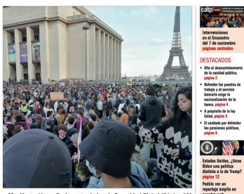
Manifestación en París contra la ley de Seguridad Global (Página 12)