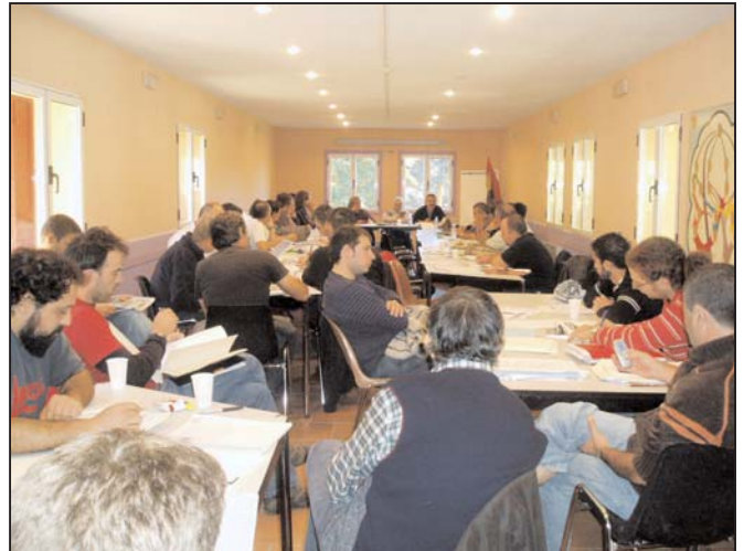
Los delegados en el Congreso escuchan al ponente

se reclaman de la clase obrera, PSOE, PCE y los partidos nacionalistas vasco y catalán, bajo el impulso del imperialismo norteamericano de acuerdo con la burocracia del Kremlin, acuerdo secundado por el Mercado Común de la época, la Internacional Socialista, los diferentes gobiernos entre ellos el de Giscard, y el Vaticano.