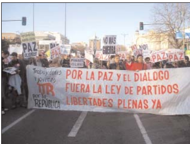
Cortejo de Trabajadores y Jóvenes por la República (TJR) en la manifestación de Madrid contra la guerra

del gobierno Aznar, el movimiento tendía a barrer el aparato de Estado y su representación política directa, el Partido Popular, movimiento que concluyó con la victoria electoral del PSOE y que detuvo momentáneamente la política impulsada por el imperialismo y la Unión Europea. El gobierno Zapatero ha intentado crear las condiciones para liberar a las instituciones de esta presión de la clase, a fin de garantizar la estricta aplicación de las directivas de la UE, la preservación de los privilegios del aparato franquista, volviendo la espalda a la mayoría obrera y popular que le había dado la victoria el 14 de marzo de 2004. Esto llevó a una situación en la que alguien tan prudente como Jordi Pujol, ex presidente de la Generalitat, ha declarado que lo que hoy está en crisis es el conjunto de las instituciones que han gobernado durante treinta años.