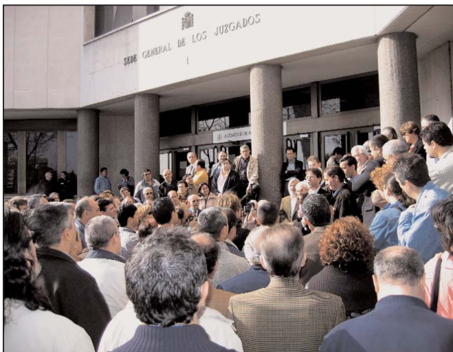
Concentración trabajadores y sindicalistas en un juicio contra represaliados por la huelga del 20J

La clase obrera se ha constituido como clase única edificando con su trabajo el marco económico común levantado por todos los pueblos del Estado español, conquistando libertades democráticas y derechos sociales, y sobre todo construyendo sus organizaciones de clase a escala estatal. Todos los pueblos del Estado español se asientan sobre estos cimientos: el marco económico, las conquistas democráticas y sociales. Romperlos sería dislocar a la clase y destruir todos y cada uno de los pueblos. La clave de la defensa de todo ello es la clase obrera, con el “juntos podemos” de sus huelgas generales. Y en particular sus organizaciones: de 2000 a 2004 son UGT y CCOO, y en otra medida el PSOE, los que han vertebrado todo el ascenso de la movilización unida de trabajadores y pueblos que acabó echando del Gobierno al PP.