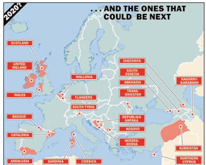
Según Times este podría ser el mapa de Europa en 2020

- durante 30 años los dirigentes políticos y sindicales de los trabajadores han impuesto en las organizaciones la unidad antiterrorista, primer eje de división y de confrontación entre los pueblos.